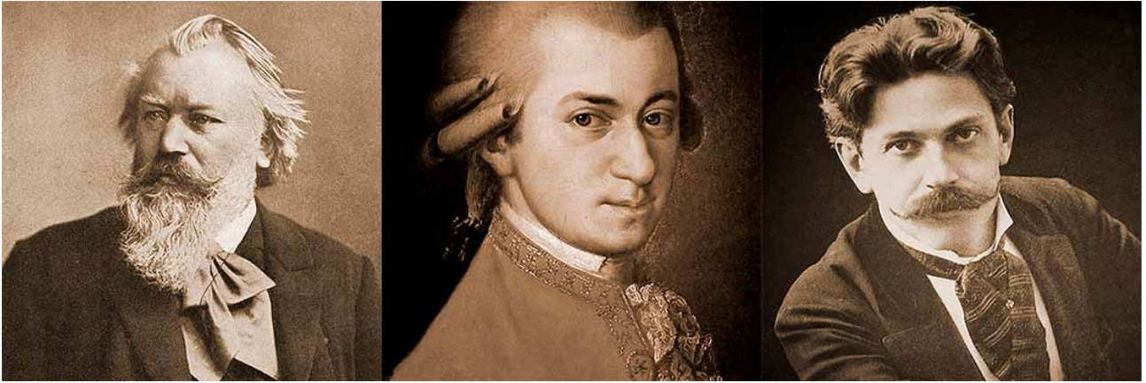
Van links naar rechts: Johannes Brahms, Wolfgang Amadeus Mozart en Ludwig Thuille