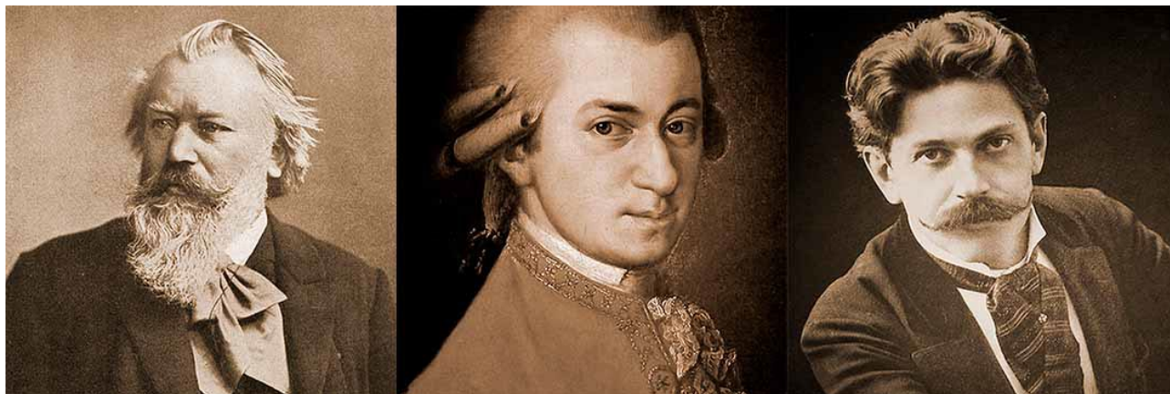
Van links naar rechts: Johannes Brahms, Wolfgang Amadeus Mozart en Ludwig Thuille