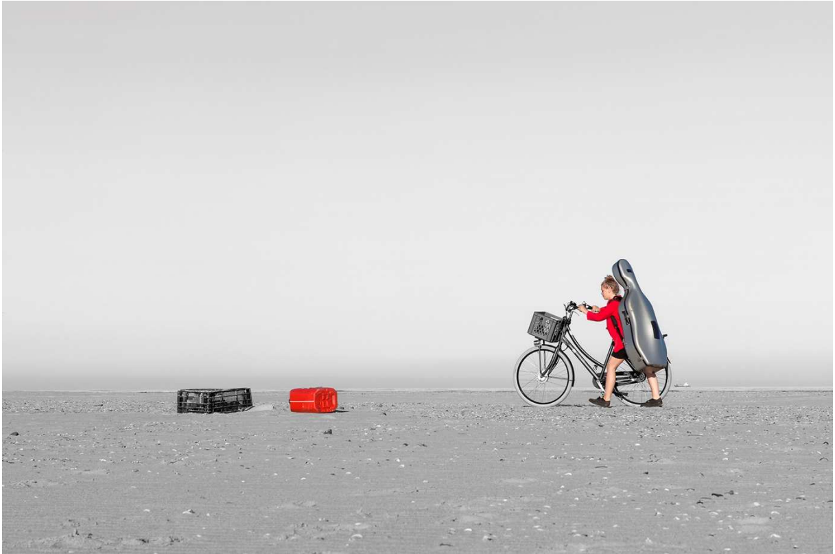
Met muziek van Vivaldi, Bach, Haydn, Brahms, Rachmaninov, Glazoenov, Britten en Schumann.